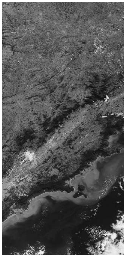
Serra da Mantiqueira vista do espaço

O conteúdo original do livro “Mantiqueira - O Castelo das Águas”, estará à disposição dos interessados no site da Secretaria, além de poder ser consultado na Biblioteca da Companhia de Tecnologia de Saneamento Ambiental - CETESB, bem como no Centro de Referências de Educação Ambiental da SMA, ambos na capital paulista.